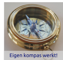
Eigen kompas werkt!